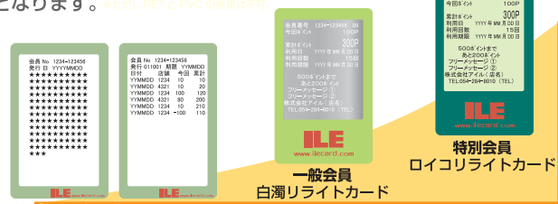
新規会員 追記式サマーカード